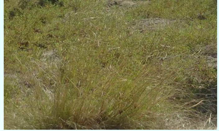
B班:シナダレスズメガヤ