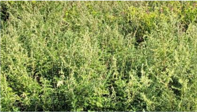
C班:ヒメムカシヨモギ