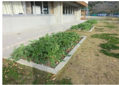
順調に育った聖護院大根