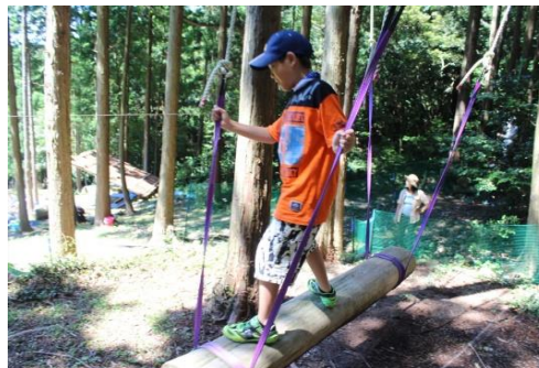
森の中で自然の遊びを体験