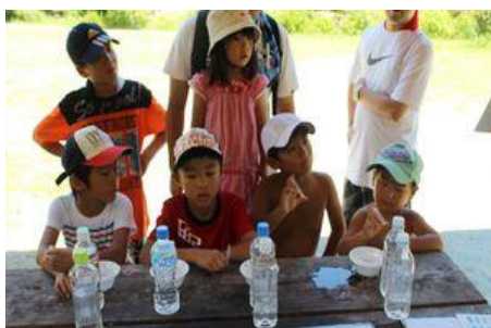
水質検査で川の環境を比較