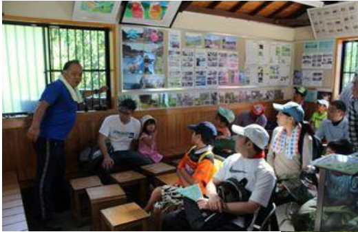
おちばの里親水公園 今川の上流域