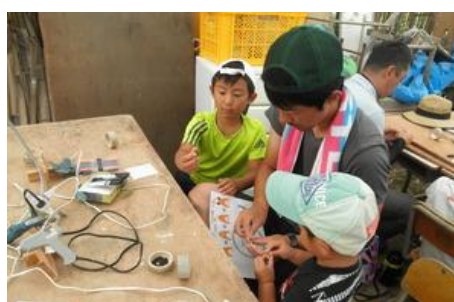
森の自然の材料でクラフトを体験