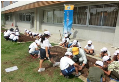
庄内学園の校舎南側花壇への種まき(2年生)