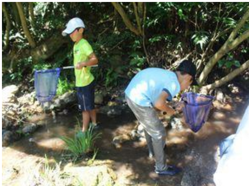
浜名湖に注ぐ川 「今川」の上流で いきもの観察