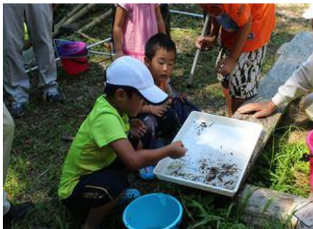
採取したいきものをみんなで観察