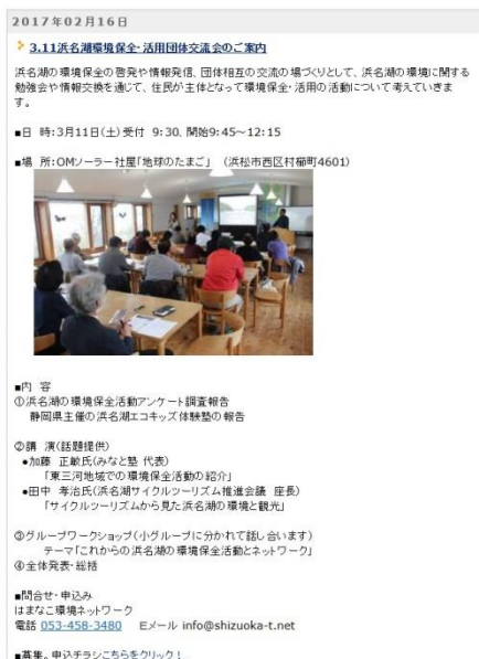
ブログでの情報発信