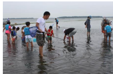
アマモ場の観察・いきもの観察